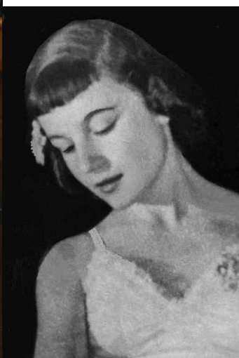
Egy másik balerina!

A Gasztro Klub kedvéért a mai (vasárnapi) menü: Finom új karalábéból készült leves, vaj nokedlivel Petrezselymes burgonya, egyben sült fasírt, uborka és francia saláta, Eper/vanília/csoki fagyi, tejszínhabbal, keksz (Kávé, ásványvíz)